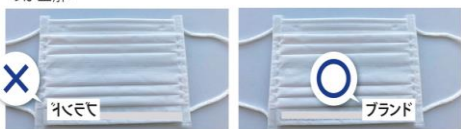
ブランドの名前など外から読めれば正しい裏表

見つけ方 2 ロゴ(名前)が読める側が外側。 ブランドなどロゴを表示しているマスクなら、相手から読めるように付けるのが正解!