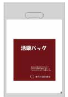
藤沢市版ブラウンバッグ 『活薬(かつやく)バッグ』

皆様も日常的に服用している薬や健康食品をチェックしてもらってはいかがでしょうか？薬の飲み残し（残薬）の管理もかかりつけの「おくすり相談薬局」が相談に乗ってくれます。一度、薬剤師に相談してみてください。